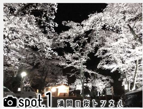
spot.1 満開の桜トツネル