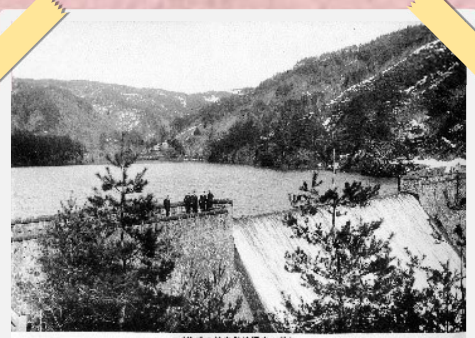
—旧美敷水源地風景(1911年)—

学校の遠足先や絵葉書になるなど当時から観光名所とされ、今もたくさんの写真が残されています。なかでも旧美敷水源地の桜は、開花を市報で知らせるほどの人気ぶりでした。現在では、成人式や結婚式の前撮りに来られる人もおられます。