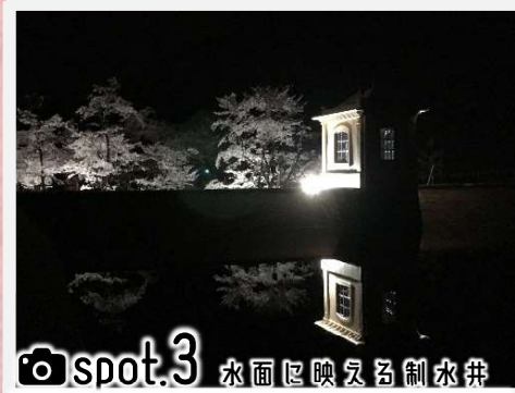
spot.3 水面に映える制水弁