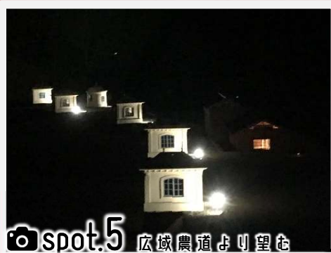
spot.5 広域農道より望む