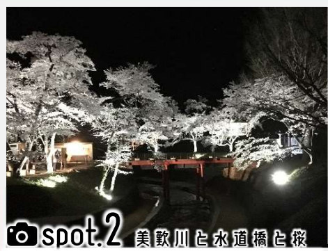
spot.2 美敷川と水道橋と桜