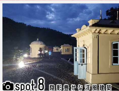
spot.8 陰影豊かな洋風建築