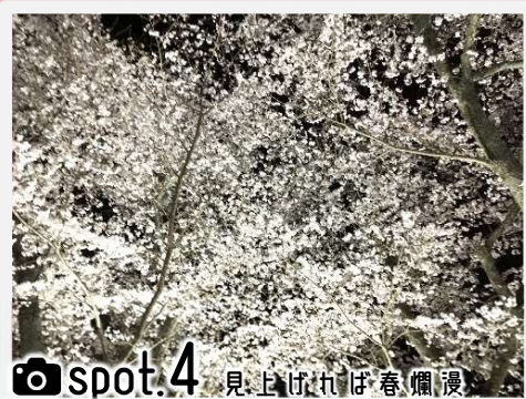
spot.4 見上げれば春爛漫