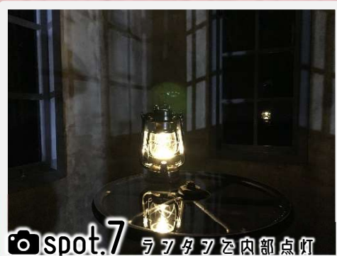
spot.7 ラフタラ内部点灯